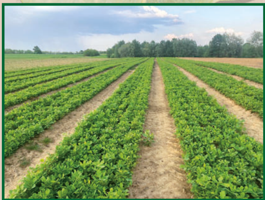
Kocsánytalan tölgy (Quercus petraea) csemete

Horváth Kert – csemete nevelése a magyar erdők szolgálatában