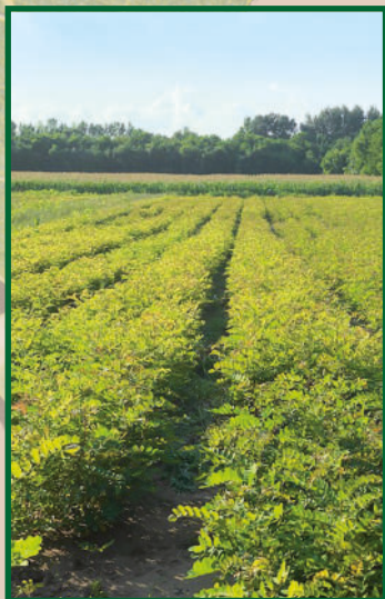
Akác (Robinia pseudoacacia) csemete

Horváth Kert – csemete nevelése a magyar erdők szolgálatában