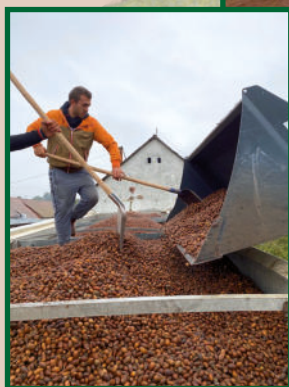
24 tonnás tétel Kocsánytalan tölgy ( Quercus petraea ) makk pakolása 2020.