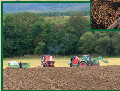
Tölgy makk vetés