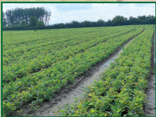
Kocsányos tölgy (Quercus robur) csemete