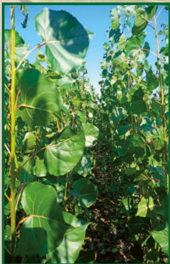
Nemesnyár (Populus) csemete