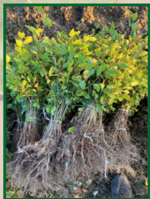
Bükk ( Fagus sylvatica ) csemete

Horváth Kert – csemete nevelése a magyar erdők szolgálatában