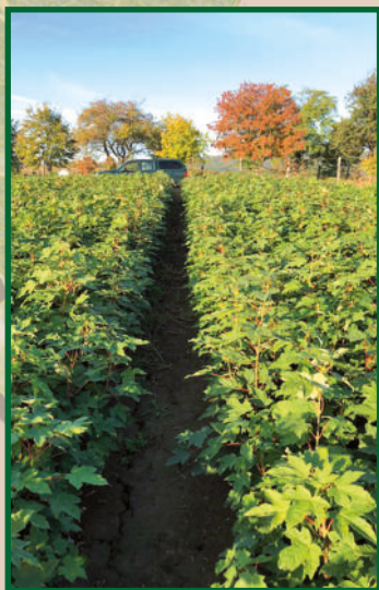
Hegyi juhar (Acer pseudoplatanus) csemete

Horváth Kert – csemete nevelése a magyar erdők szolgálatában