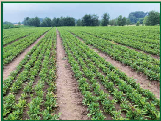
Cser (Quercus cerris) csemete