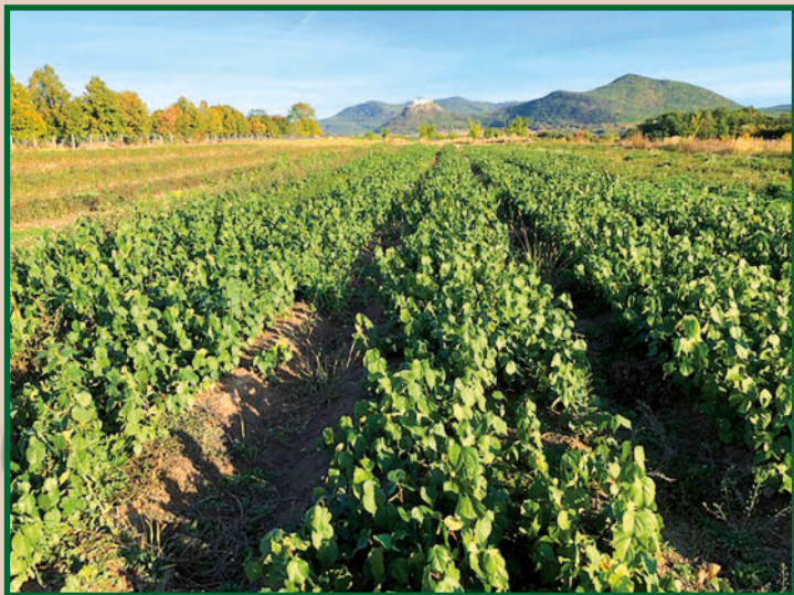
Kislevelű hárs (Tilia cordata) csemete