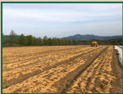
Apró mag vetés