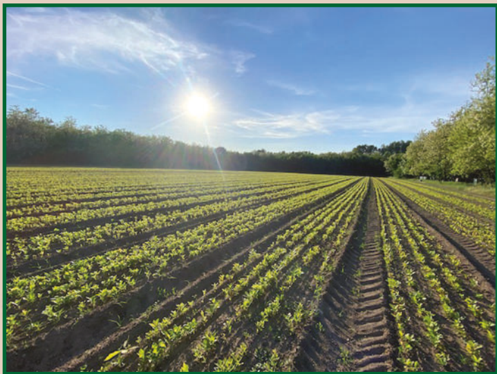
Cser (Quercus cerris) csemete